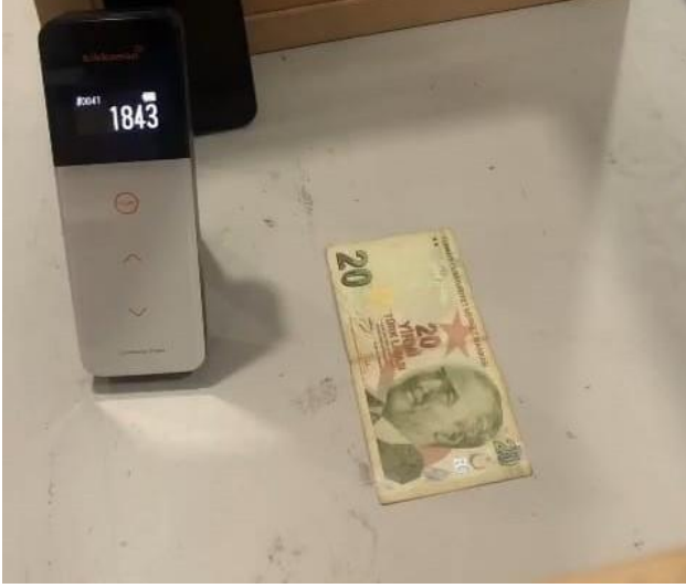
Fotoğraf 5: Bio Steril LED uygulamasından önce kontaminasyon seviyesi