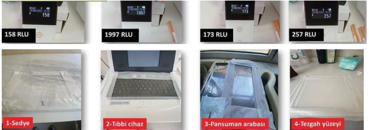
Fotođraf 8: Bio Steril LED uygulamasından sonra kontaminasyon seviyesi