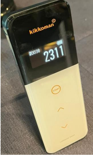
Fotoğraf 3: Bio Steril LED uygulamasından önce kontaminasyon seviyesi