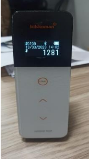
Fotoğraf 12: Bio Steril LED uygulamasından sonra kontaminasyon seviyesi