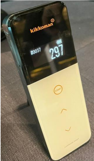
Fotoğraf 4: Bio Steril LED uygulamasından sonra kontaminasyon seviyesi