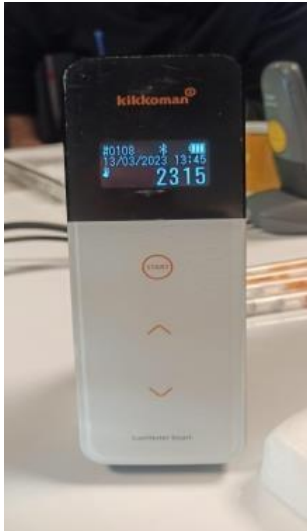
Fotoğraf 11: Bio Steril LED uygulamasından önce kontaminasyon seviyesi