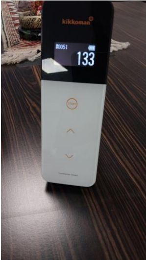
Fotoğraf 2: Bio Steril LED uygulamasından sonra kontaminasyon seviyesi