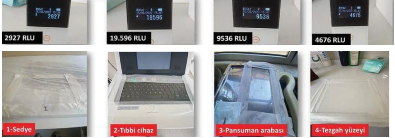
Fotođraf 7: Bio Steril LED uygulamasından önce kontaminasyon seviyesi