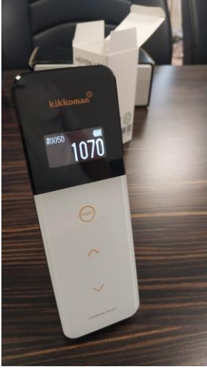
Fotoğraf 1: Bio Steril LED uygulamasından önce kontaminasyon seviyesi