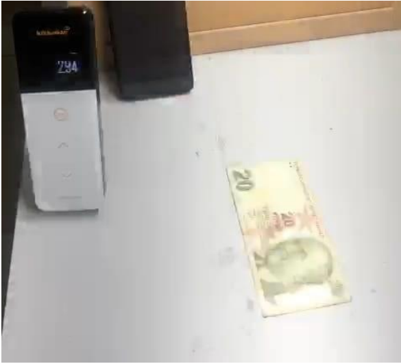
Fotoğraf 6: Bio Steril LED uygulamasından sonra kontaminasyon seviyesi